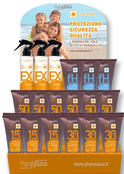
Espositore da banco